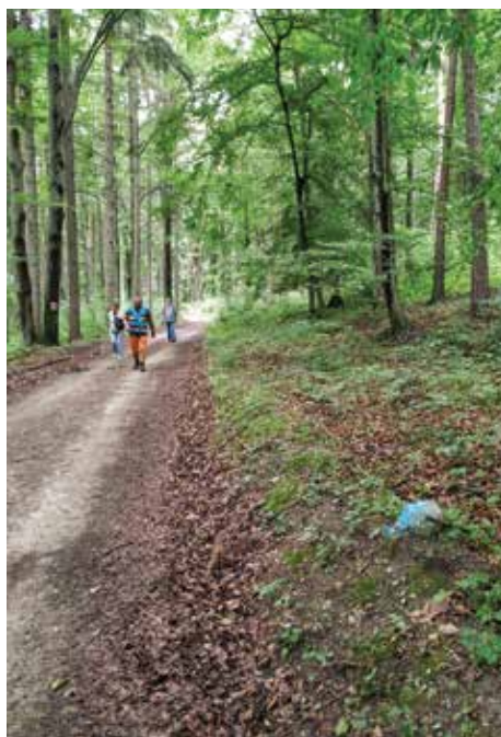
Kellemes gyaloglás a volt Monarchia két országa közötti határon