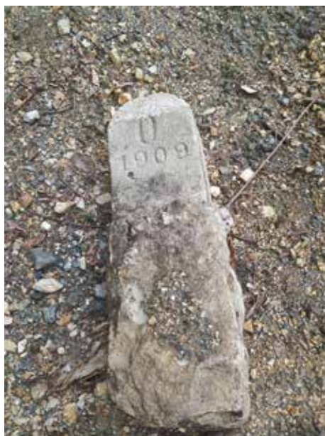
Határkövek az Osztrák Császárság és a Magyar Királyság határán