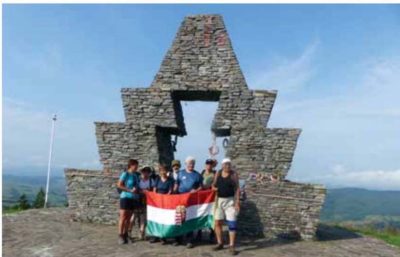
Az ezer éves határ felderítése közben a Vereckei-hágónál 2019-ben