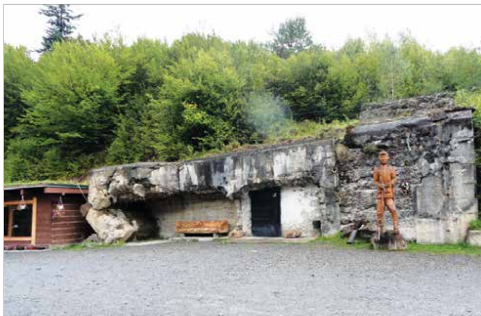
Az Árpád-vonal mentén 2018-ban